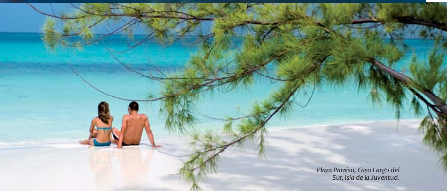
Playa Paraíso, Cayo Largo del Sur, Isla de la Juventud.

Por su ubicación geográfica y sus bondades marinas, Cuba constituye, además, un excelente punto de recalo para los yatistas que recorren el Caribe. La Isla posee marinas y puertos deportivos que garantizan los servicios necesarios para una estancia satisfactoria. A estos beneficios se suma la plataforma insular cubana, conformada por un extenso y valioso arrecife coralino propicio para el buceo.