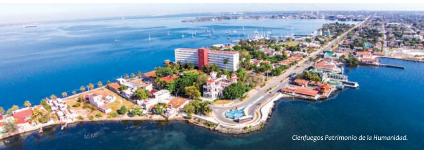
Cienfuegos Patrimonio de la Humanidad.