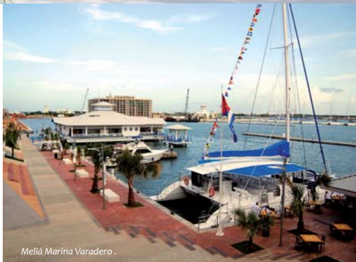
Meliá Marina Varadero.

Sensorial y auténtica como es, Cuba es la isla al centro del Caribe que recibe al visitante y lo cautiva concediéndole la sorpresa. ▣