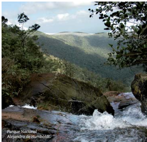
Parque Nacional Alejandro de Humboldt.

P rometedora, como imaginan quienes la sueñan, y fascinante, según muchos que han desandado sus calles, visto sus paisajes y conocido a su gente, Cuba se precia de ser un auténtico destino para vacacionar.