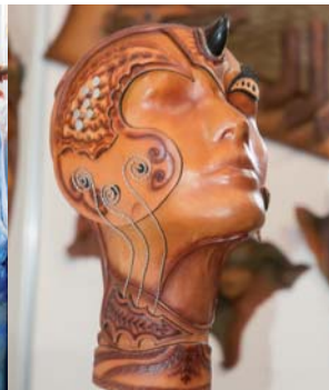
Stand: Pieles Oi - etiqueta de cuero.

A la entrada del espacio expositivo, el stand de Cienfuegos, provincia surcentral a la cual se dedicó la feria recibía al visitante. En tanto, las piezas textiles ocuparon buena parte del lugar.