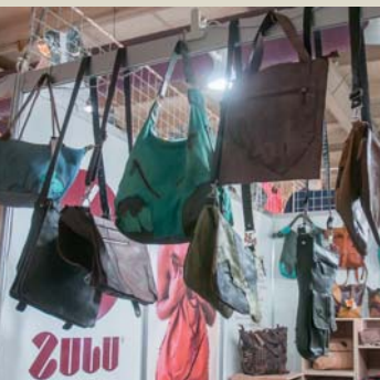
Stand: Proyecto Zulu (Ganadores de la categoría de productos para su colección de bolso y bolsa).

Además de feria comercial y exposición de artesanías, el evento acogió encuentros teóricos y otorgó varias distinciones: el reconocimiento por la Obra de la Vida, los Premios FiarT y el Premio al Mejor Exportador. □