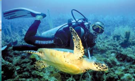
Archipiélago Los Canarreos.