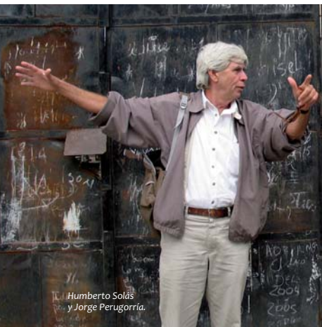
Humberto Solás y Jorge Perugorria.