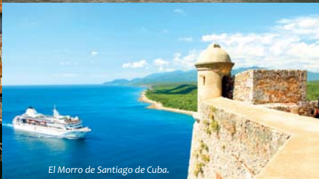
El Morro de Santiago de Cuba.