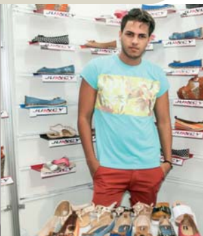
Stand: Juancy - calzado artesanal de la provincia de Granma.