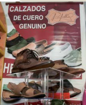
Papillón - calzado artesanal.

La cita con sede principal en el recinto ferial Pabexpo —ubicado en el oeste de la capital cubana— reunió a un centenar de artesanos de Asia, Europa y América Latina, y a más de medio millar de creadores cubanos.