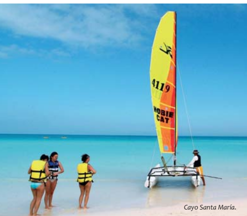
Cayo Santa María.

Isla de curiosos contrastes; su verde tropical combina con conservadas ciudades de siglos de existencia: Baracoa, Bayamo, Trinidad, Camagüey, Sancti Spiritus, Santiago de Cuba, La Habana; todas ellas reciben gustosas a visitantes de todas partes del mundo para mostrarles sus encantos y develarles sus historias. En todas, un detalle que apasiona; en cada una, vestigios del pasado que le han proporcionado su valor patrimonial.