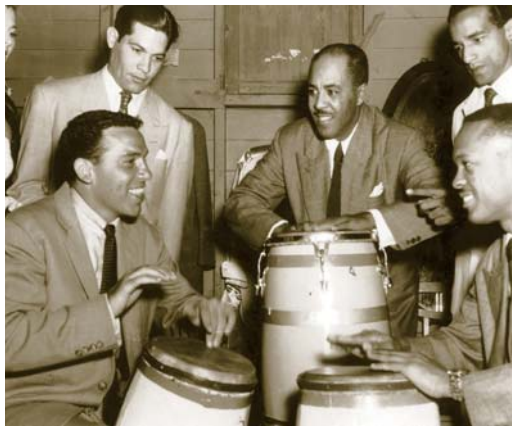
Buddy Rich junto a Barreto en La Habana en el año 1950.