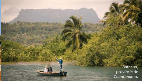
Baracoa, provincia de Guantánamo.