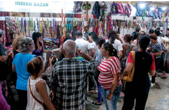
Stand Bazar Indio.