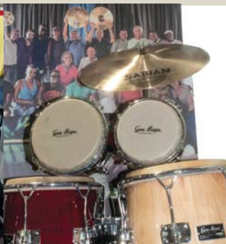
Instrumentos de percusión de Canadá.