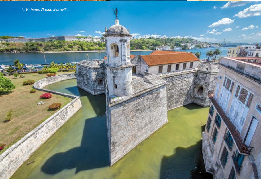
La Habana, Ciudad Maravilla.